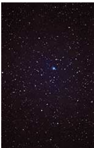
cometa Ikeya-Zhang (5)

La Ikeya Zhang , al contrario delle sere precedenti, mostra una filiforme coda e a testimonianza della limpidezza del cielo, riesco a puntare col Dobson svariate difficili galassie , come la NGC 4236 nel Drago, molto larga e appena staccabile dal fondo cielo.