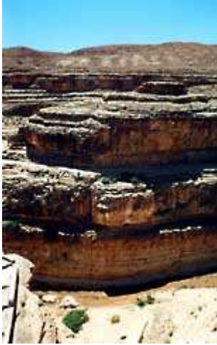
Mides ( 1 )