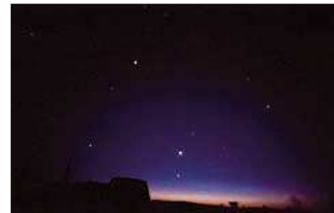
Congiunzione planetaria ( 5 )