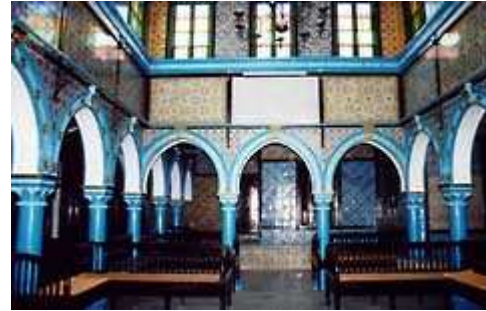
Sinagoga di Ghriba ( 3 )

Subito dopo affrontiamo il lungo percorso che ci separa da una delle mete più attese del viaggio: l'oasi di Ksar Ghilaine , in pieno deserto del Sahara . Lungo la strada compaiono le prime dune di sabbia e gli autisti si improvvisano piloti della Parigi-Dakar , volando letteralmente da una duna all'altra, fra l'apprensione e il turbamento dei proprietari delle costosissime attrezzature astronomiche, legate al portapacchi.