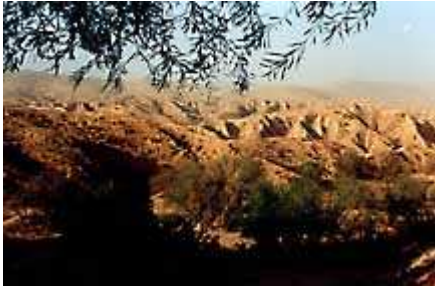
Paesaggio a Matmata ( 2 )

Finalmente la furia si placa e possiamo riprendere il viaggio alla volta di Matmata , ancora più a sud, attraversando un paesaggio arido e lunare , il cosiddetto deserto roccioso; da tempo si sono perse le tracce della vegetazione.