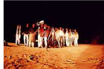
Il gruppo a Mos Eisley ( 1 )

Una volta scesi non abbiamo più dubbi, si tratta di un nuovo set di Guerre Stellari , nientemeno che lo spaziorporto di Mos Eisley , sul pianeta Tatooine , crocevia di alieni provenienti da tutta la galassia, dove Skywalker incontra Han Solo e dove tutto è stato mantenuto perfettamente integro a distanza di 26 anni dal ciak .