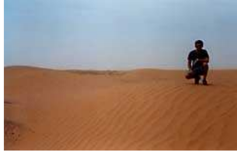
primo impatto col Sahara ( 1 )