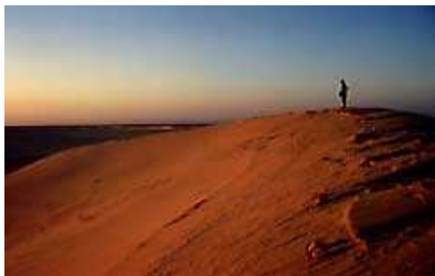
Davide: lo Jedi del deserto? ( 3 )