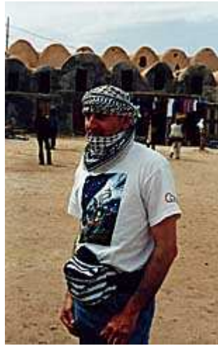
Un uomo al bivio: Presidente o Sceicco? ( 2 )