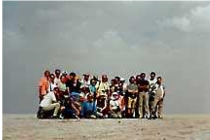
Via Lattea ( 4 )

Il giorno dopo, 10 Maggio , sotto un Sole cocente e un cielo limpidissimo, abbandoniamo il suggestivo campo tendato e approdiamo alla città di Douz , salutati dal Muezzin , che intona preghiere da un vicino minareto e nel pomeriggio, attraversando le oasi di Ksar Tarcine, Oum Ech Chia, Zaafrane e Nouil , ci addentriamo nel gigantesco lago salato di Chott el Jerid .