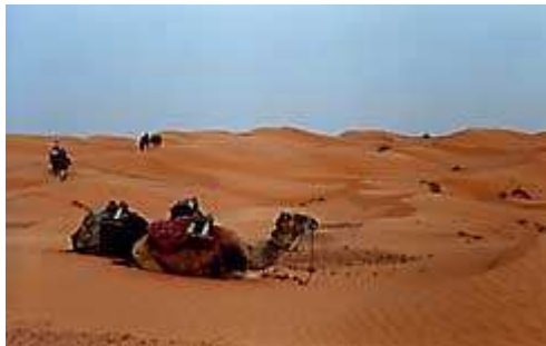
dromedari a riposo ( 1 )