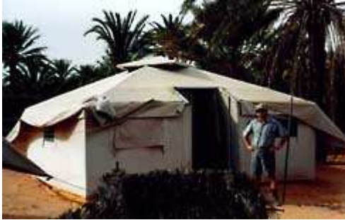
la nostra tenda