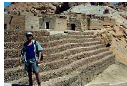
Massimiliano a Chebika ( 2 )

Nella mattinata del giorno 11, effettuiamo un'interessante passeggiata alla pittoresca città di Tozeur , molto cara al cantautore Franco Battiato , e di seguito alle stupende oasi di montagna di Chebika , antico posto di guardia romano, con lussureggianti palmeti aggrappati ai fianchi delle montagne, Tamerza , con le sue fresche cascate e Mides , tra impressionanti canyon.