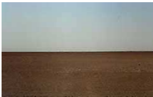
Miraggi all'orizzonte ( 4 )

Emozionanti particolari mostrano poi le più famose nebulose del Sagittario ed il gruppo si mette in coda ai vari strumenti, producendosi in una serie di confronti e commenti entusiastici, un vero e proprio StarParty!