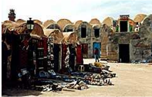
Souk di Medenine ( 2 )