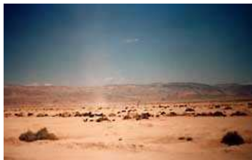
Un Dust Devils ( 1 )