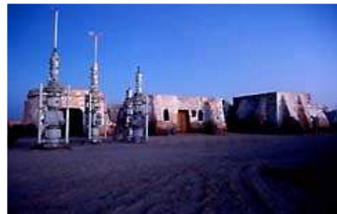
Mos Eisley ( 3 )