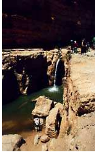
Tamerza ( 4 )