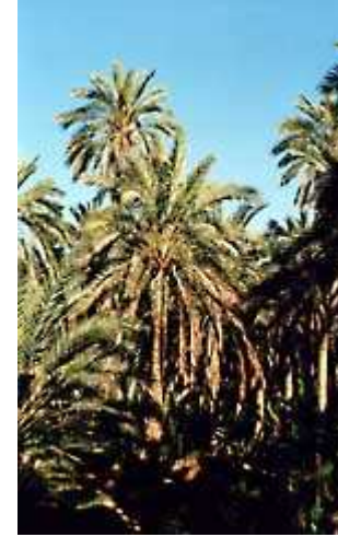
Oasi di Nefta ( 2 )

Alle 18.00, siamo pronti per tornare a Mos Eisley , assistere al tramonto e rimanere direttamente sul luogo, accampandoci con qualche panino, portato appositamente per la cena.