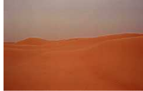
le dune ( 3 )

Fortunatamente nel corso del pranzo, l'aria bollente lascia il posto ad una brezza leggera, indispensabile per la traversata del deserto in dromedario , che ci aspetta nel pomeriggio.