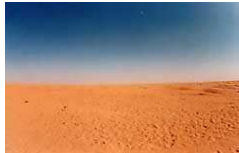
Il deserto al mattino ( 1 )