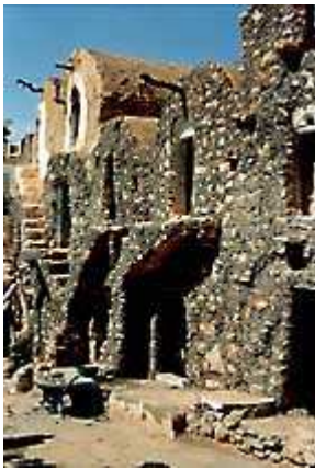
Ksar Haddada ( 2)

Il giorno 8 si presenta estremamente ventoso, ma finalmente sereno e la carovana di jeep in stile " Overland ", procede con rinnovato entusiasmo tra i mille sobbalzi e gli splendidi panorami, che ci conducono a Ksar Haddada ("Ksar", è un termine che ha il significato di granaio collettivo fortificato).