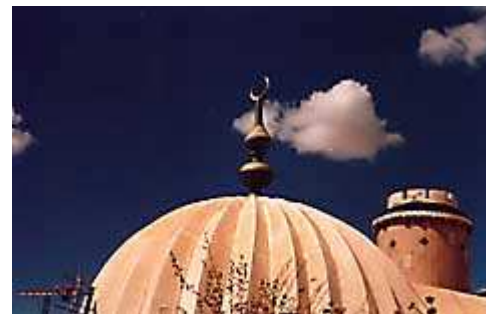
tMoschea di Keirouan ( 3 )