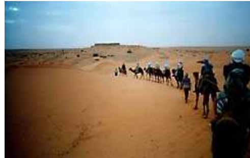
la carovana ( 2 )