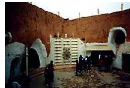
ILa Casa di Skywalker ( 1 )

In serata uno sguardo al cielo rivela una densa cappa nuvolosa, che impedisce purtroppo le osservazioni.